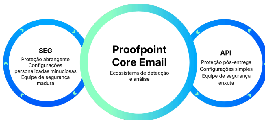
Figura 3. O Proofpoint Core Email Protection oferece opções de implantação com gateway de e-mail seguro (SEG) e API.